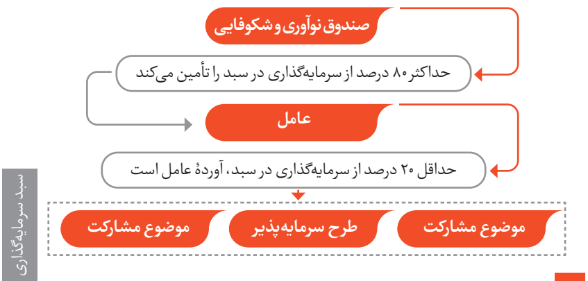
شکل ۱. مدل دو جزئی

همان‌گونه که در شکل ۱ مشخص است، این روش از مشارکت بین صندوق و عامل به‌عنوان ارکان مشارکت خواهد بود. صندوق در این قالب حداکثر ۸۰ درصد نقدینگی موردنیاز را تأمین می‌کند و عامل نیز متعهد خواهد بود حداقل ۲۰ درصد از نقدینگی موردنیاز هر موضوع مشارکت را از منابع خود شخصا تأمین کند.