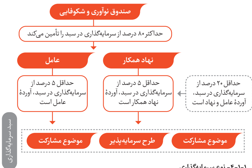
شکل ۲. مدل سه جزئی

ارکان مشارکت در این مدل شامل صندوق، عامل و یک جزء سوم به نام نهاد همکار است. در این قالب مجموع تامین مالی عامل و نهاد همکار باید حداقل ۲۰ درصد باشد و حداکثر ۸۰ درصد نقدینگی موردنیاز توسط صندوق تامین می‌شود. نکته‌ی حایز اهمیت این است که آورده‌ی نقدی هیچ یک نمی‌تواند کمتر از ۵ درصد باشد. هدف از ایجاد این مدل از مشارکت امکان همکاری با سایر نهادها مانند دانشگاه‌ها، پژوهشکده‌ها، مراکز تحقیقاتی، پارک‌های علم و فناوری، شتاب‌دهنده‌ها و... است. براین اساس تمامی بازیگران فعال در اکوسیستم نوآوری کشور در صورتی که بتوانند با یکی از عاملین به تفاهم دست یابند می‌توانند سرمایه موردنیاز موضوعات مشارکت خود را در این قالب مرتفع کنند. در این مدل مجدداً تمامی تعاملات صندوق با عامل است و فرایندهای اجرایی متفاوت از مدل دوجزئی نیست.